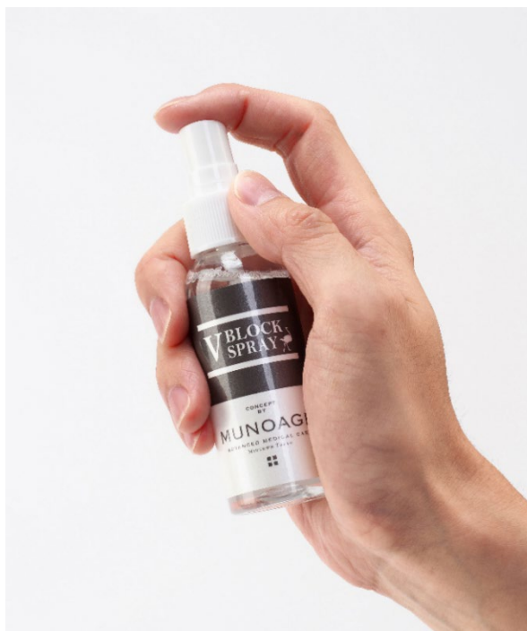
ミュノアージュ V BLOCK スプレー

リゾートトラスト株式会社(以下、リゾートトラスト)のグループ企業である株式会社アドバンスト・メディカル・ケア(東京都港区、代表取締役社長:古川哲也)は、スキンケアブランド「MUNOAGE(ミュノアージュ)」から、ダチョウ卵黄エキス※ 1 を配合した化粧水「ミュノアージュ V BLOCK スプレー」を12月10日(木)に発売します。