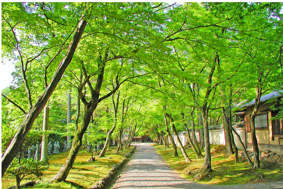
サステナブルコト体験 「宝厳院の春の特別拝観」

[ホームページ] https://www.rtg.jp/hotels/smc/k_saga/reco/detail/?reco=00061