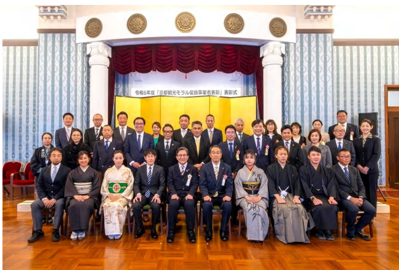
令和6年度「京都観光モラル優良事業者表彰」表彰式