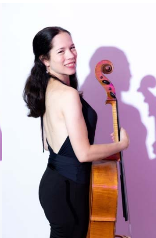
チェロ アイリス・レゲヴ