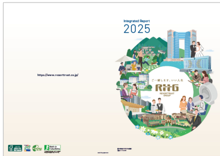
統合報告書 2025 表紙／裏表紙

本報告書は、株主・投資家をはじめとする幅広いステークホルダーの皆様を対象に、リゾートトラストグループの価値創造プロセスや財務・非財務情報を統合的に構成して、経営理念やグループアイデンティティに基づいた当社グループの中長期的な企業価値向上に繋がる取り組みをご理解いただくことを目指し、作成しております。