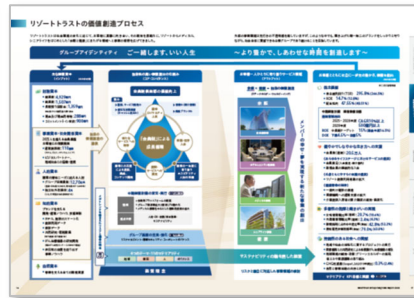
価値創造プロセス