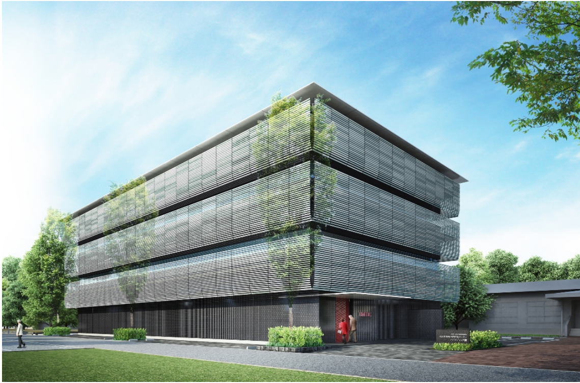
ハイメディック棟外観イメージ