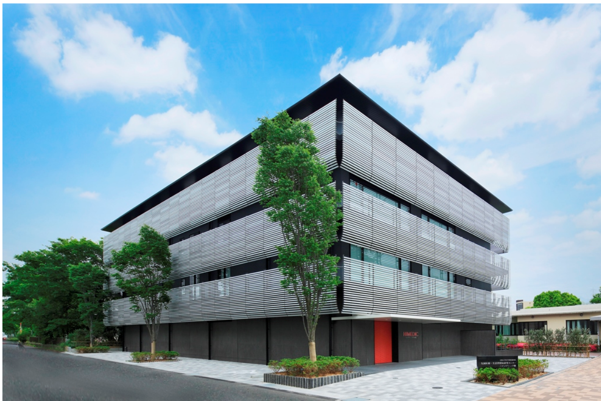
ハイメディック棟 外観