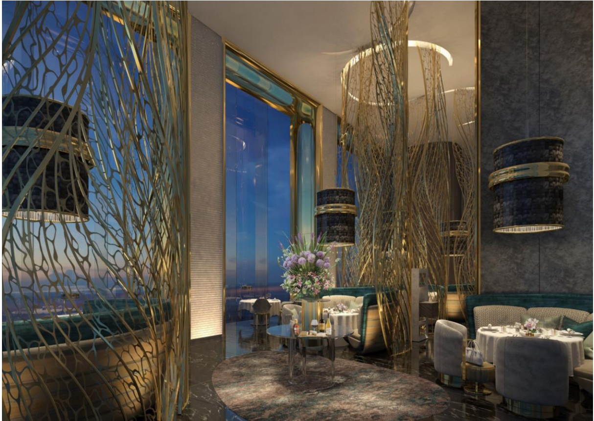
光と影の織りなす曲線のシルエットが美しい「メインダイニング」