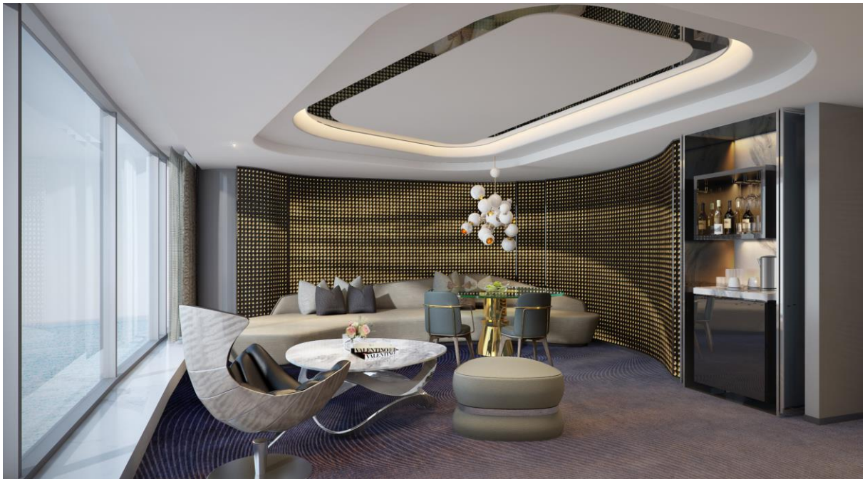
ゴールドの壁面が印象的な「ロイヤルスイートルーム」