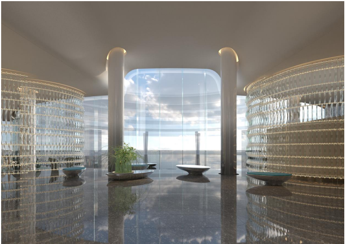
光を反射して煌めくガラスが幻想的な「エントランスロビー」