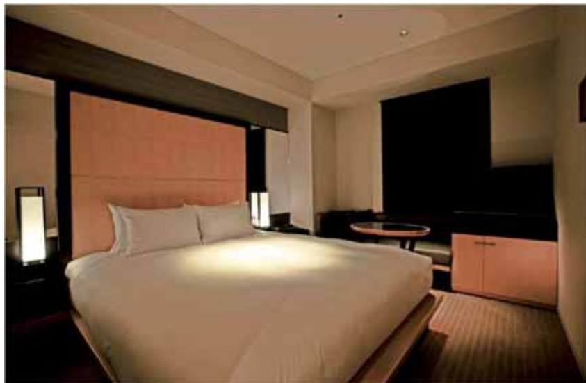
スタンダードダブルルーム

スタンダードシングルルームとバリアフリールームを除き、バスルームにシャワーブースを備えております。