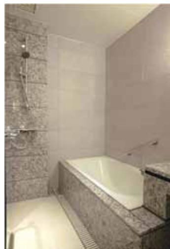
シャワーブース付きバスルーム