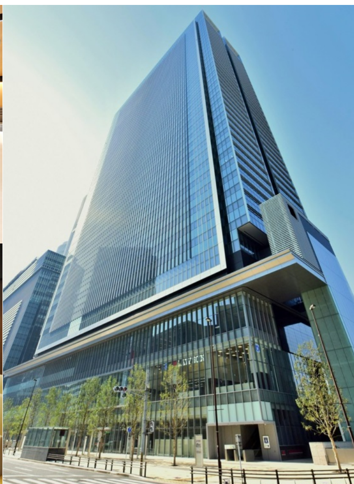
左上：受付、左下：女性用待合、右：JPタワー名古屋