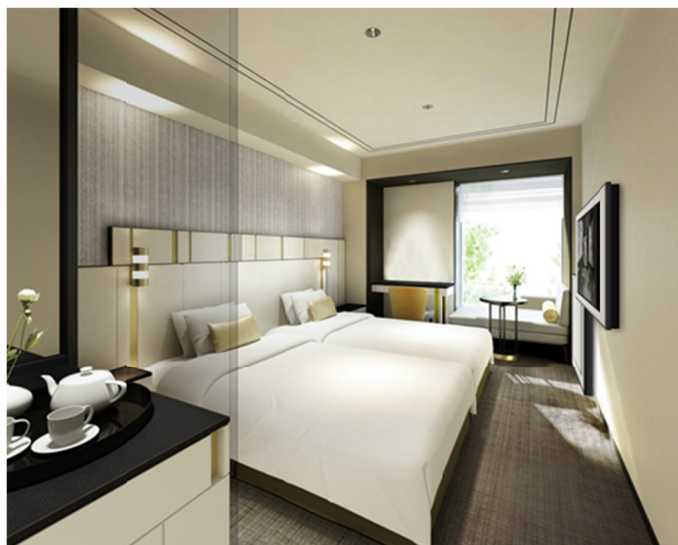
【客室 スーペリアツインルーム】 広さ 23.3 m 2 料金 43,000 円（消費税込、宿泊税別）

客室は、ゆとりとやすらぎに満ちたプライベート空間。モノトーンをベースとした繊細な空間に真鍮色のアクセントで“NIHONBASHI SECESSION”を表現した、モダンで明るく心地よいゲストルームです。