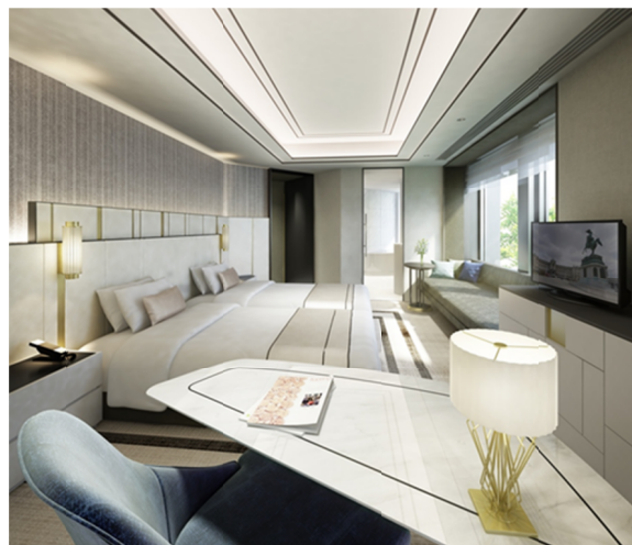
【客室 DX ツインルーム】 広さ 36.6 m 2 料金 58,000 円（消費税込、宿泊税別）