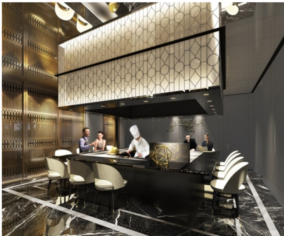
【鉄板焼レストラン】

落ち着いた色調と、幾何学模様をモダンにあしらった空間デザインが、ラグジュアリーの新潮流を思わせる鉄板焼。目の前で東京に集まる高品質の食材が、エンターテインメント性と臨場感とともに、目の前で絶品料理へと姿を変えていきます。