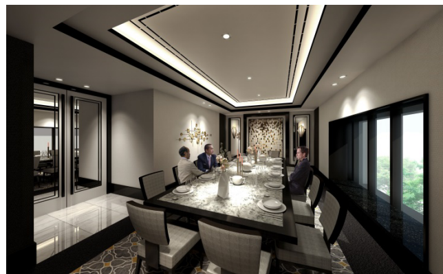
【プライベートルーム】

プライベートルームは、気品と落ち着いた雰囲気を漂わせ、会議などのビジネスユースやパーティなど様々な用途にお応えします。