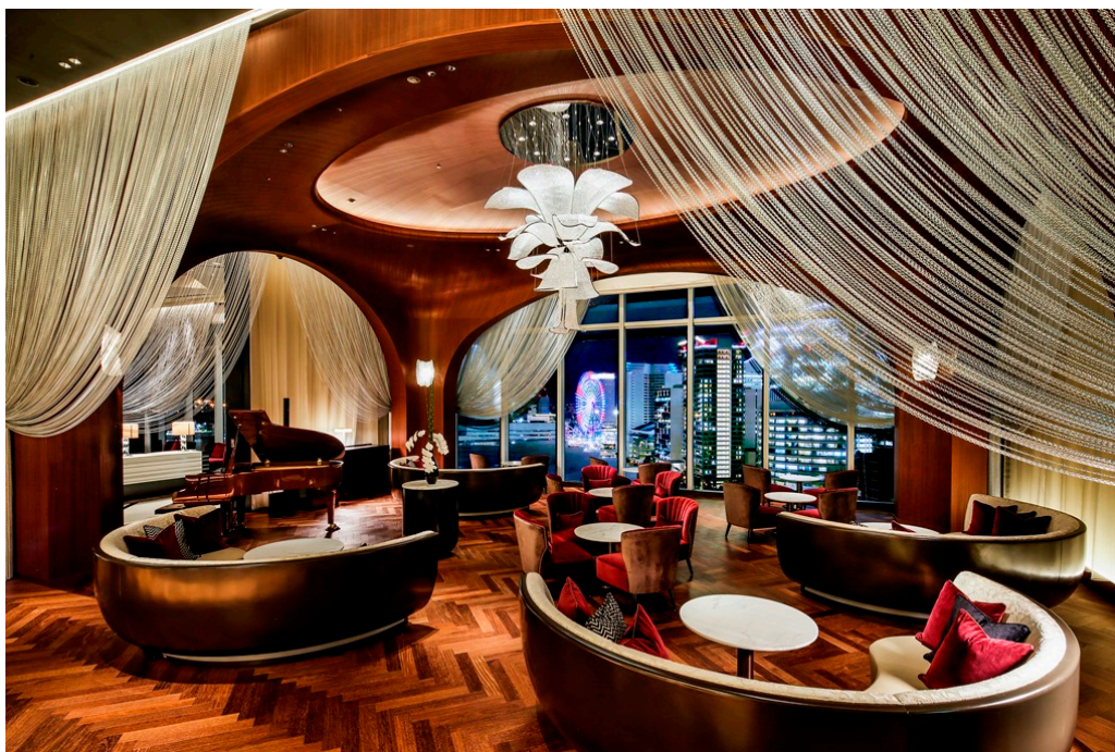
THE KAHALA LOUNGE

ホテル最上階に位置するのは、ラウンジ&バー「THE KAHALA LOUNGE」。クリスタルシャンデリアが輝き、ハワイのコアの木をイメージしたウッディな空間で日常を忘れるひとときを、お過ごしください。