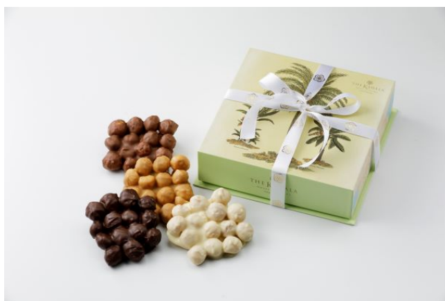
マカデミアナッツチョコレート

また、ホテルの各所には、ハワイを感じられるような様々なしかけもご用意しています。ピローケースに施されたプルメリアの刺繍、プルメリアの香りのするバスオイル(スタンダードルーム)、ラウンジではカハラズ・マイタイや、パイナップルをかたどったグラスでお楽しみいただけるキングス・ピニャコラーダなどハワイを偲ばせるエキゾチックなドリンクのほか、「RISTORANTE OZIO」のコンチネンタルブレイクファストメニューに組み込まれた、エッグベネディクト、宴会場での朝食ブッフェでは、